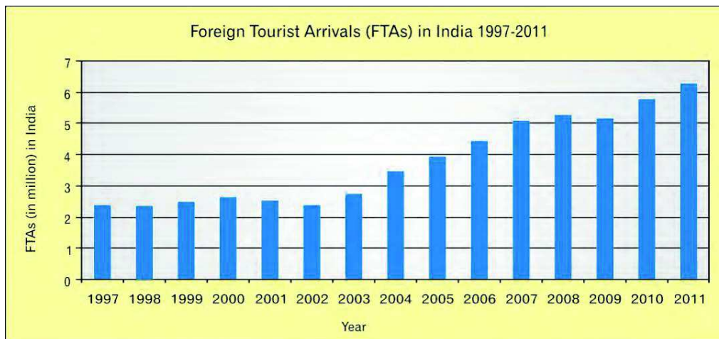
Abb. 1: Internationale Touristenankünfte in Indien. Quelle: Ministry of Tourism (2011)

Auslandsmärkten zu positionieren. Demgegenüber steht eine Realität in Indien, die einerseits Massenarmut, Korruption, Sicherheitsprobleme, Bürokratie und mangelnde Infrastruktur ebenso vorhält wie eine beeindruckende Kultur- und Naturlandschaft, gut ausgebildete englischsprachige Menschen, ethnische Vielfalt sowie Mystik und Spiritualität. Indien definiert sich – auch touristisch – durch Extreme (vgl. Freyer & Thimm 2011: 261).